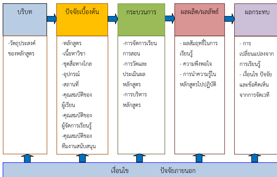
ภาพที่ 1 องค์ประกอบและตัวแปรในการประเมินหลักสูตร

ในการศึกษาวิจัยนี้ คณะผู้วิจัยได้ศึกษาเอกสารและผลงานวิจัยที่เกี่ยวข้อง และกำหนดกรอบแนวคิดการวิจัยได้ดังนี้